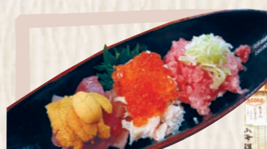
海鮮盛(ウニ、マグロ、ズワイガニ、クラ、ネギトロ) 1,300円

「せんべい汁」や「いちご煮」など、八戸の郷土料理を食べさせてくれる店。新鮮な魚介類をリーズナブルな価格で提供する店。地場産品の馬肉やシャモロック、田子ニンニクをメニューに取り入れている店。個性あふれる25店舗が軒を連ねています。