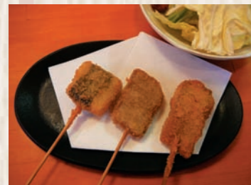
八戸前沖さば・倉石牛・長いもの3点盛り