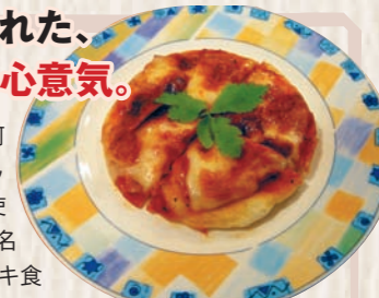
もちせんべいのピザ...400円

「マンキ」は店主の先祖「河村万吉」の愛称。万吉さんは、ホッキ貝やイカ釣りに使う漁具を考案した湊町の有名人。その血筋を継ぐ「マンキ食堂」は、むつ湊の荒波に育てられた浜っ子の心意気が売り。鮮度抜群の地物素材を豪快に楽しむのが醍醐味だ。